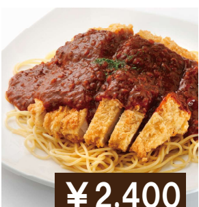
ジャンボ(Wサイズ) スパカツ Extra size spaghetti