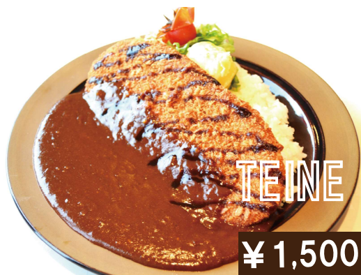
テイネスノボカレー Teine curry with Big Hamburg steak Cutlet