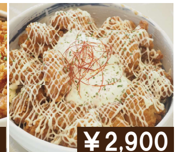
ジャンボ(Wサイズ) ザンギマヨ丼 Extra size Fried chicken rice bowl with mayonnaise