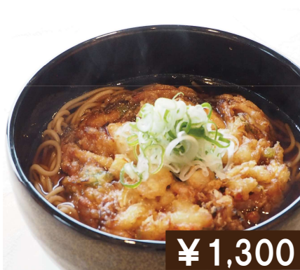
海老入りかき揚げ うどん / そば Tenpura Udon / Soba