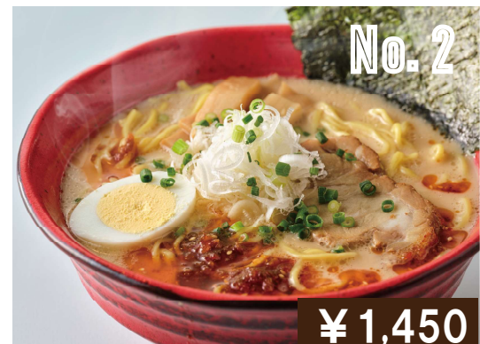
テイネラーメン (豚骨) Teine ramen (Pork bone soup)