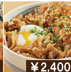
ジャンボ(Wサイズ) スタミナ旨カツ丼 Extra size pork and pork cutlet bowl