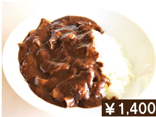
ハッシュドビーフ Hash de beef