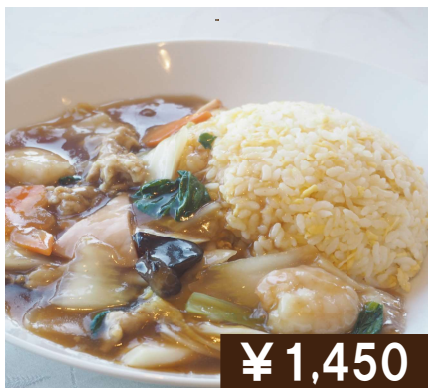
あんかけチャーハン Fried rice with starchy sauce