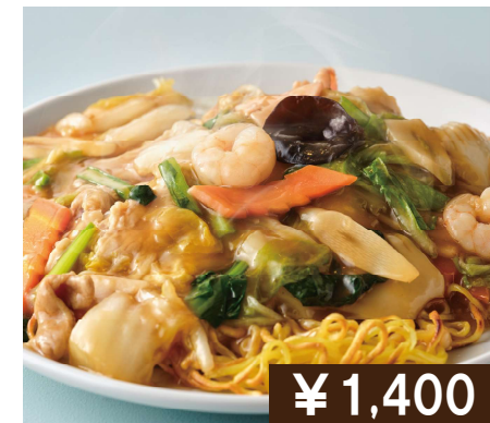
あんかけ焼きそば Fried noodles with starchy sauce