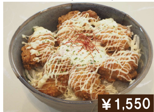
ザンギマヨ丼 (温玉乗せ) Fried chicken rice bowl with mayonnaise on egg