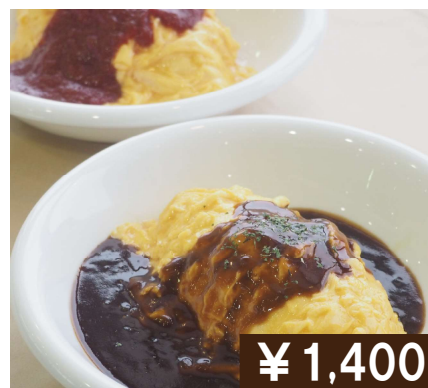
とろとろオムライス デミグラスソース or トマトケチャップ Omlette with rice