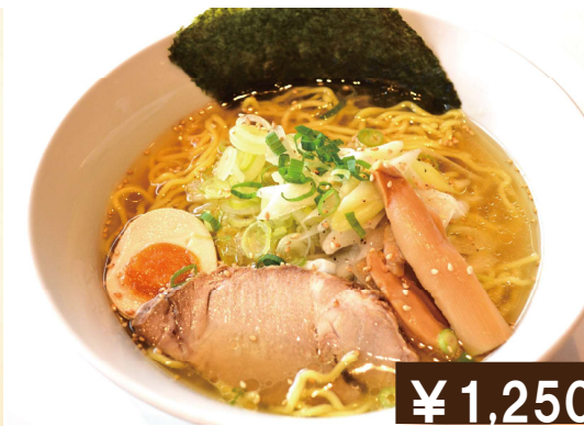
函館ネギ塩ラーメン Salt onion ramen