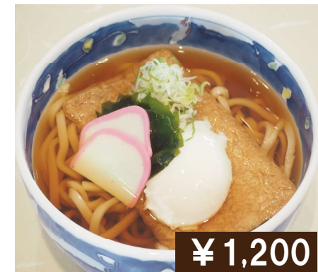
温玉きつね(うどん / そば) Kitsune Udon / Soba