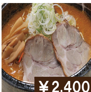
ジャンボ(Wサイズ) 味噌ラーメン Extra size miso ramen