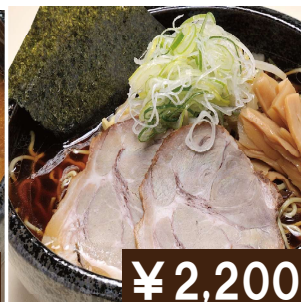
ジャンボ(Wサイズ) 醤油ラーメン Extra size soy sauce ramen