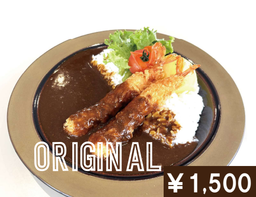
テイネスキーカーレー Teine curry With Shrimp Cutlet