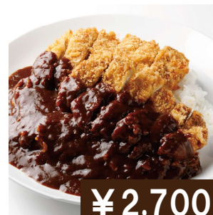
ジャンボ(Wサイズ) カツカレー Extra size pork cutlet curry