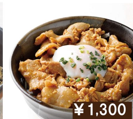
スタミナ丼 Rice bowl with topped stir-fried pork