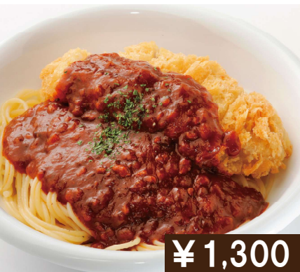
スパカツ Meat sauce spaghetti with pork cutlet