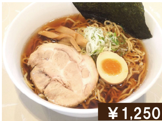
旭川煮干し醤油ラーメン Soy sauce ramen