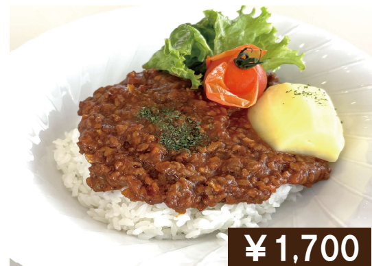
ヴィーガン認証キーマカレー Vegan certification Keem curry (Soy meat)