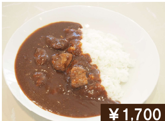
やわらか牛タンカレー Ox tongue curry