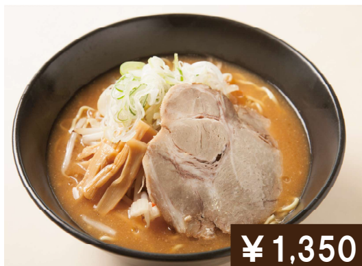
札幌野菜味噌ラーメン Miso ramen