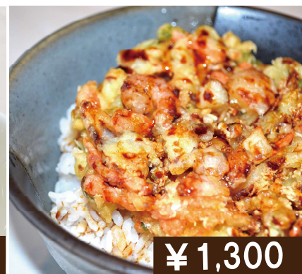
海老入りかき揚げ丼 Tenpura rice bowl