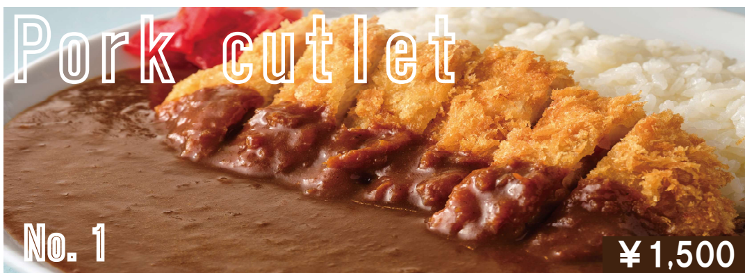
こだわり仕込みのカツカレー Pork cutlet curry