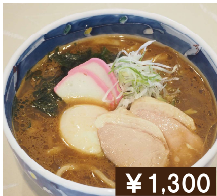
鴨・カレー南蛮(うどん/そば) Duck curry nanban Udon / Soba