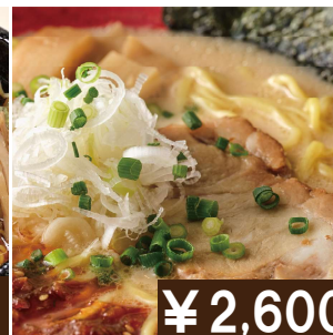
ジャンボ(Wサイズ) ティネラーメン Extra size Teine ramen (Pork bone soup)