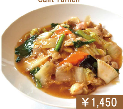
あんかけ焼きそば Fried noodles topped with starchy sauce