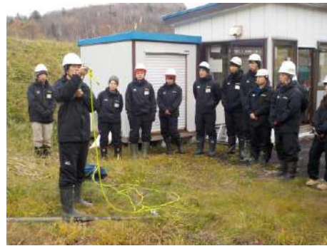
平成 30 年 11 月 11 日従業員教育 2 日目