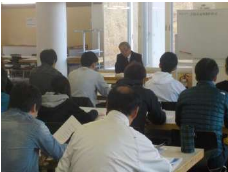
平成 30 年 11 月 11 日従業員教育 2 日目