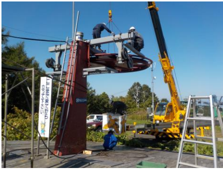
(3) 白樺平第3リフト、折返滑車軸受交換