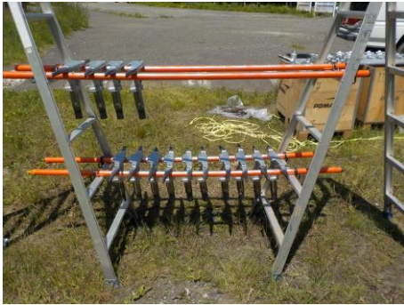
(1) 白樺平第1Aリフト、握索機交換