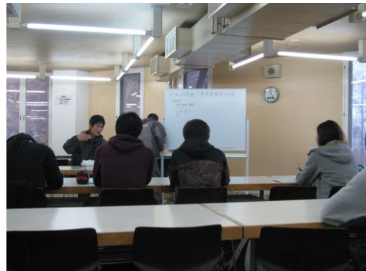
平成 27 年 11 月 14 日従業員教育 1 日目