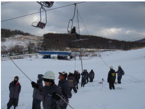
平成26年11月16日従業員教育2日目