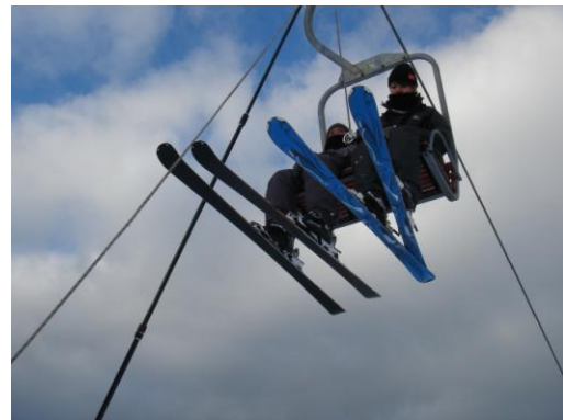
平成26年11月16日従業員教育2日目