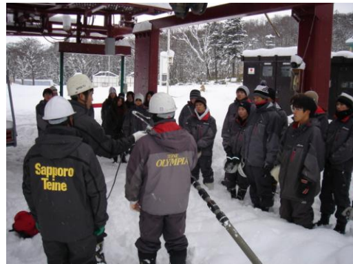
平成26年11月15日従業員教育1日目