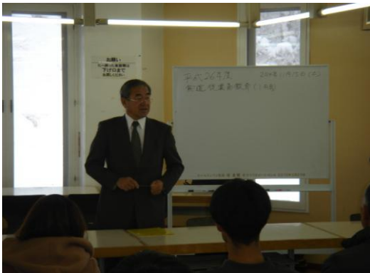
平成26年11月15日従業員教育1日目