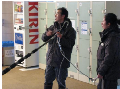
平成 24 年 11 月 18 日従業員教育 2 日目