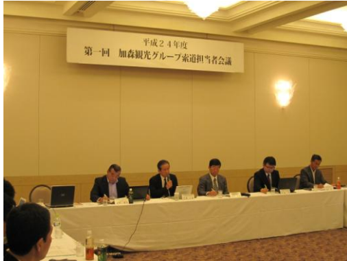
平成24年度加森観光グループ索道担当者会議 第1回会議の様様（平成24年6月11日）