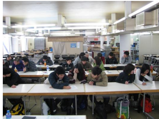
平成 24 年 11 月 17 日従業員教育 1 日目