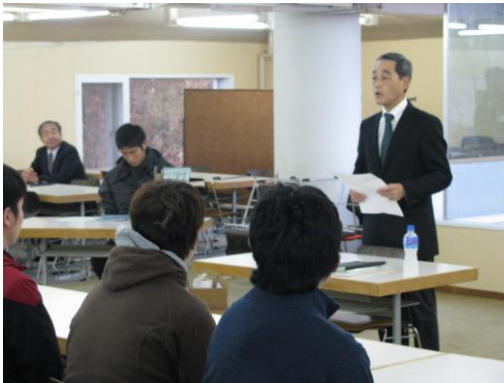
平成 24 年 11 月 17 日従業員教育 1 日目

(2) 2012年 11月 17～18日 …… スキー場オープンに向けて従業員教育を実施しました。