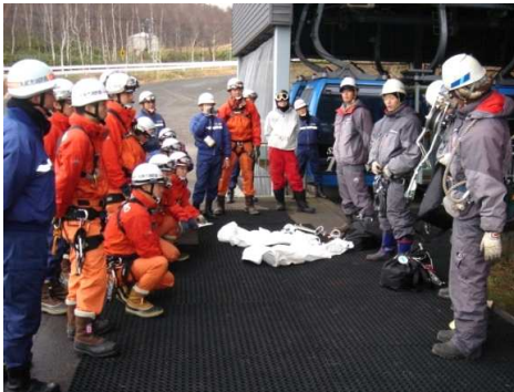
平成22年度エイトゴンドラ消防合同救助訓練 救助用具説明（11月22日）

サッポロテイネでは毎年、冬シーズン開始前に万一の事故や災害（索道が運転不能となった場合）を想定した救助訓練や、予備原動機の操作訓練、従業員の社内研修を実施し、特に救助関係では手稲消防署様と協力した訓練を行うなど万全の体制を整えています。