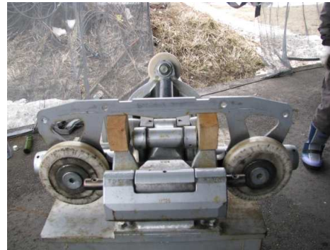
エイトゴンドラ握索機整備（4月17日）