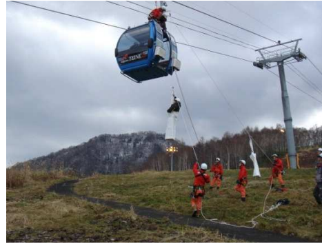
平成22年度エイトゴンドラ消防合同救助訓練 救助模擬実地（11月22日）