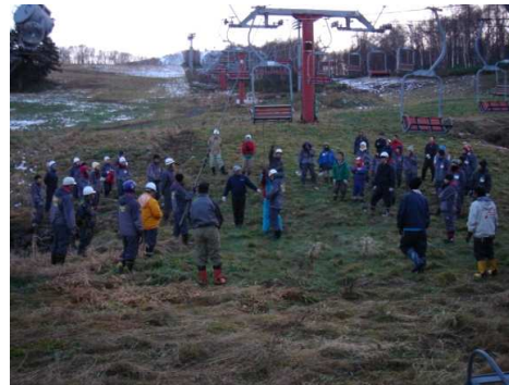
平成22年度従業員教育一日目 現地救助訓練（11月13日）