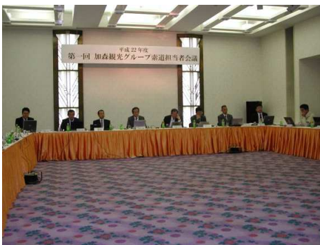
平成22年度加森観光グループ索道担当者会議 会議（6月17日）… 夕張リゾートホテル