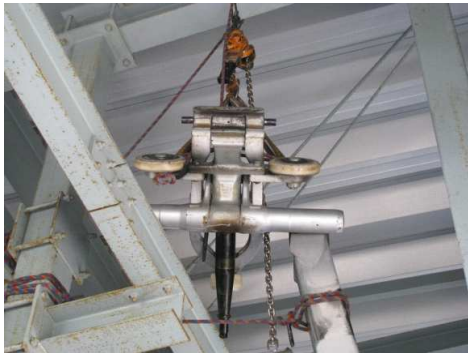
エイトゴンドラ握索機整備（4月7日）