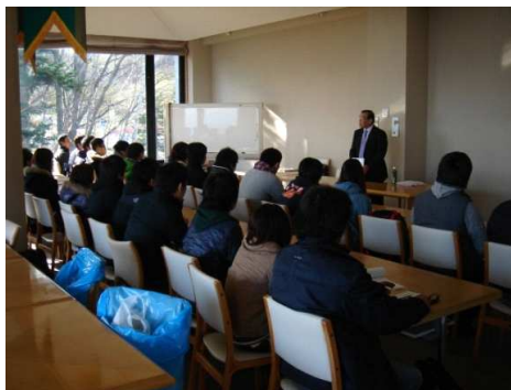
平成22年度従業員教育一日目 座学（11月13日）