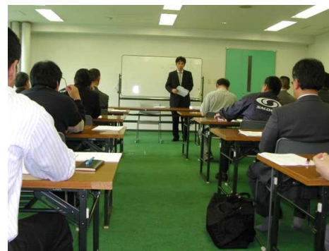
平成22年度加森観光グループ索道担当者会議 研修会（6月17日）… 夕張リゾートホテル