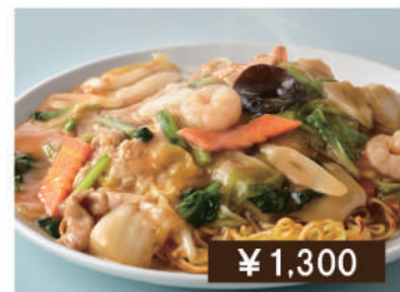
あんかけ焼きそば Fried noodles with starchy sauce