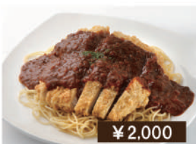
男前スパカツ Extra size spaghetti