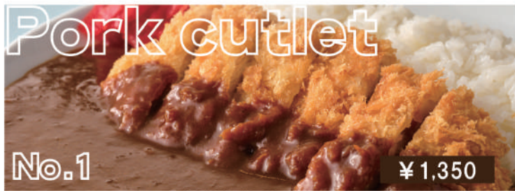
こだわり仕込みのカツカレー Pork cutlet curry