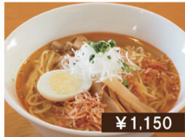
函館海老塩ラーメン Salt shrimp ramen