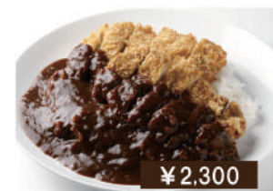
男前カツカレー Extra size pork cutlet curry