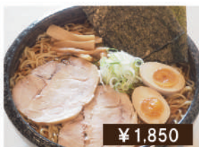
男前醤油ラーメン Extra size soy sauce ramen