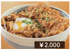
男前スタミナ旨カツ丼 Extra size pork and pork cutlet bowl