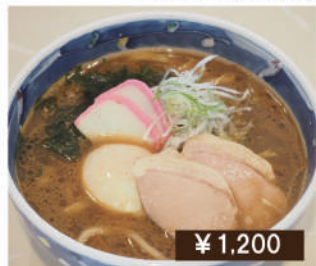
鴨・カレー南蛮 うどん / そば Duck curry nanban Udon / Soba