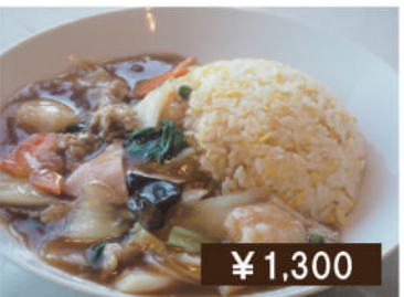
あんかけチャーハン Fried rice with starchy sauce