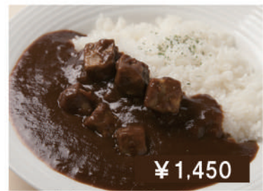
やわらか牛タンカレー Ox tongue curry