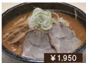
男前味噌ラーメン Extra size miso ramen