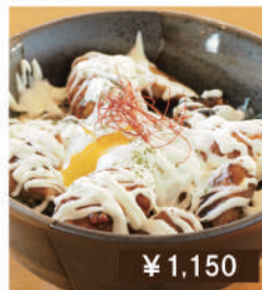
軟骨つくね焼き鳥マヨ丼 Yakitori bowl with mayonnaise