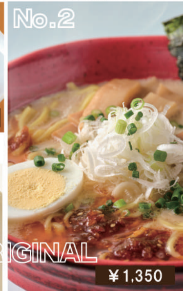
テイネラーメン (豚骨) Teine ramen (Pork bone soup)