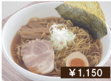
旭川煮干し醤油ラーメン Soy sauce ramen