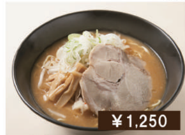
札幌野菜味噌ラーメン Miso ramen