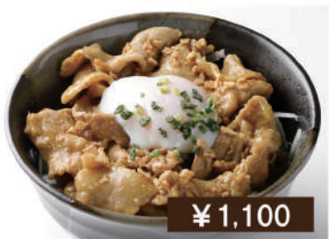
スタミナ丼 Rice bowl with topped stir-fried pork