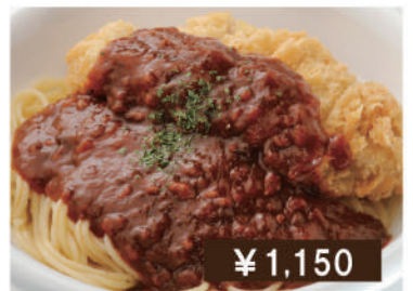
スパカツ Meat sauce spaghetti with pork cutlet