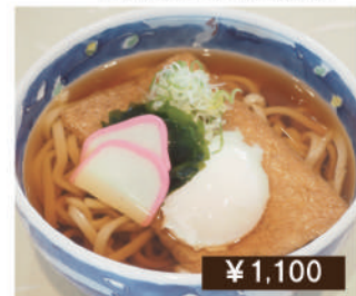
温玉きつね うどん / そば Kitsune Udon / Soba