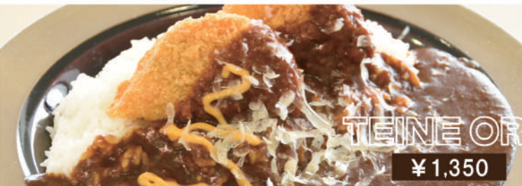
テイネカレー (かぼちゃコロッケ入り) Teine curry with pumpkin croquette