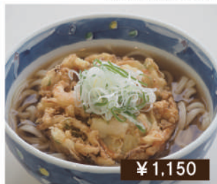
海老入りかき揚げ うどん / そば Kakiage Udon / Soba