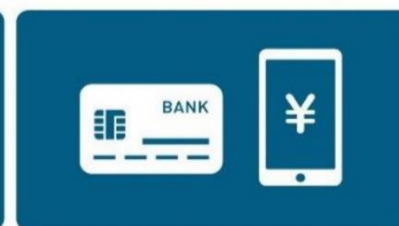
キャッシュレス決済の推奨