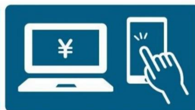
WEB事前申込・事前決済の推奨