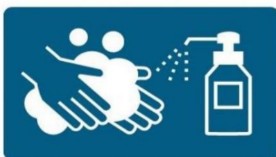
手洗い・消毒のご協力